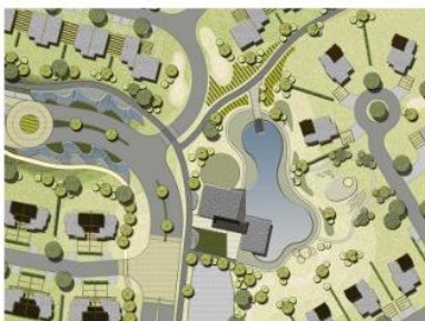
BARCELONA DE INDIAS - GRUPO VERDE

En Colombia, los arquitectos paisajistas buscan aprovechar las oportunidades del mercado a través de las Sociedad Colombiana de Arquitectos Paisajistas (SAP); pese a ello, aún la oferta de esta clase de especialistas es muy reducida, por lo que existe oportunidades para el ingreso de nuevos agentes que estén en la capacidad de brindar servicios tanto de diseño como de desarrollo. Algunos proyectos a cargo de la SAP son: Murallas de Cartagena, Barcelona de Indias, Museo Cerros Orientales, Parque del Agua y Pueblo Viejo.