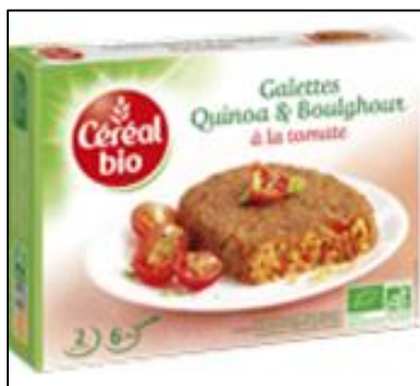
Tortillas de quinua y bolgour Mercado: Francia