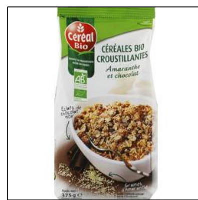
Cereal de kiwicha con chocolate Mercado: Francia