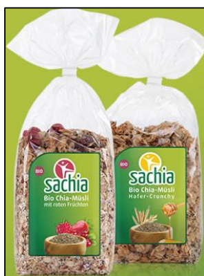
Muesli de chía con frutos rojos o miel Mercado: Alemania