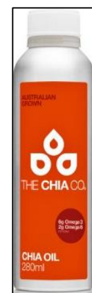
Aceite de chía Mercado: Reino Unido