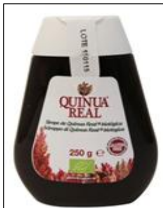
Sirope de quinua Mercado: España