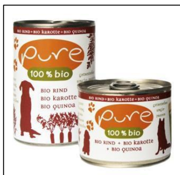
Comida orgánica para perros a base de kiwicha y quinua Mercado: Austria